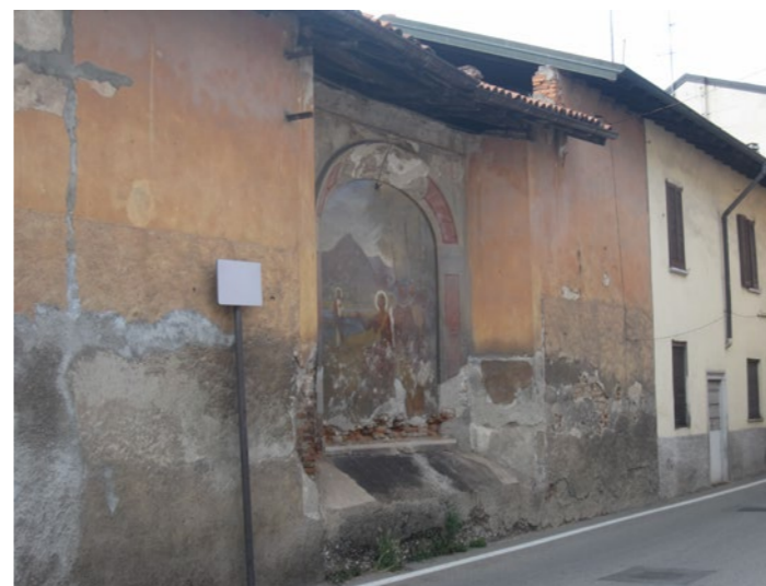
Stato attuale dell'opera e della struttura.

L'analisi tecnica della situazione rendono necessari i seguenti interventi: